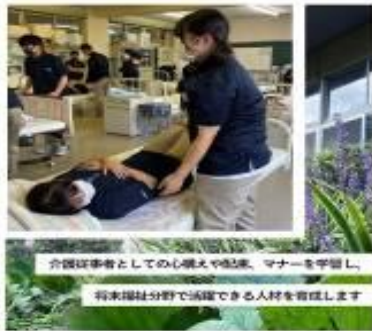
介護従事者としての心構えや配慮、マナーを学習し、 将来福祉分野で活躍できる人材を育成します